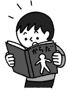
体について学びたいとき

ないかけんしん ししん ちんしん ちゅうしん おこな ちょうしん せきちゅう けんさ かんせんしょうたいさく 内科検診では視診と問診を中心に行います。聴診・脊柱の検査については、感染症対策