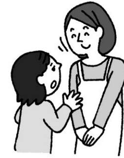
悩みや心配があるとき